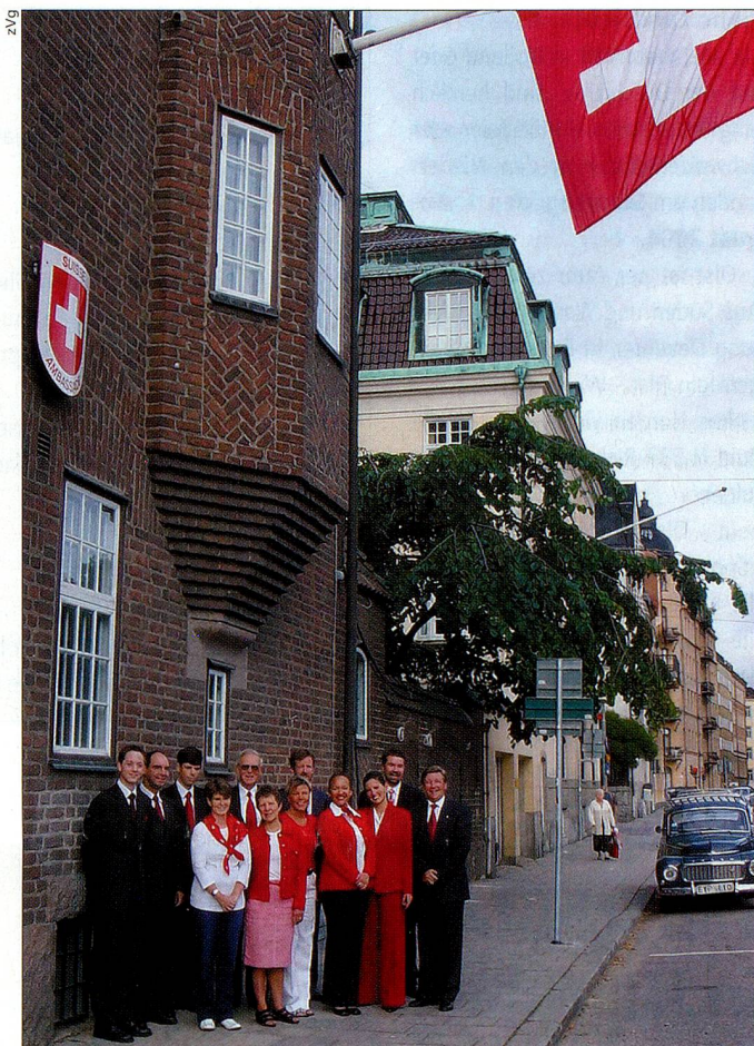
Die Mitarbeiter der Schweizerischen Botschaft freuen sich darauf, Sie in ihren neuen Büros am Valhallavägen bedienen zu können.