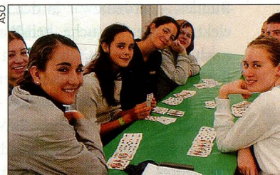
In den Workshops wird nicht nur gearbeitet ...

In den zweiwöchigen Sprachkursen können Auslandschweizer Deutsch oder Französisch lernen. In unserem Workshop bringen wir euch den Finanzplatz Schweiz näher. Mit einer Teilnahme an der Eidgenössischen Jugendsession erlebt ihr die direkte Demokratie der Schweiz hautnah. Unsere aufgeschlossenen Gastfamilien erwarten euch und lassen euch teilhaben am schweizerischen Alltag.