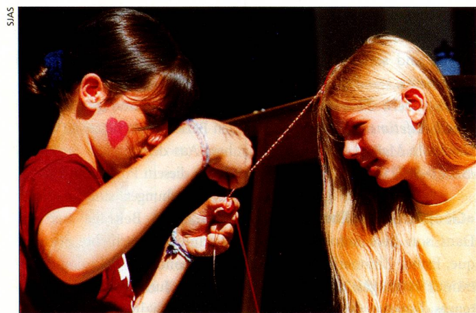
Der Kreativität sind keine Grenzen gesetzt. Und Freundschaften können über Jahre bestehen bleiben.

Am Sonntag haben die Kongressteilnehmer die Wahl zwischen zwei Exkursionen im wunderbaren Kanton Wallis. Im Programm enthalten ist unter anderem ein Besuch der Paul-Signac-Ausstellung in der renommierten Fondation Gianadda in Martigny.