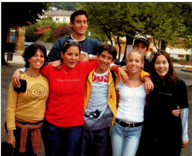
Die Sommerlager auf den Flumserbergen werden wieder Gelegenheit zu neuen Freundschaften bieten.

Auskünfte und Informationen zu den genannten Angeboten unter Auslandschweizer-Organisation (ASO), Jugenddienst Alpenstr. 26, 3000 Bern 16 Tel.: ++41 (0)31 356 61 00 Fax.: ++41 (0)31 356 61 01 youth@aso.ch, www.aso.ch