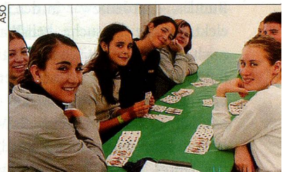
In den Workshops wird nicht nur gearbeitet ...

In den zweiwöchigen Sprachkursen können Auslandschweizer Deutsch oder Französisch lernen. In unserem Workshop bringen wir euch den Finanzplatz Schweiz näher. Mit einer Teilnahme an der Eidgenössischen Jugendsession erlebt ihr die direkte Demokratie der Schweiz hautnah. Unsere aufgeschlossenen Gastfamilien erwarten euch und lassen euch teilhaben am schweizerischen Alltag.