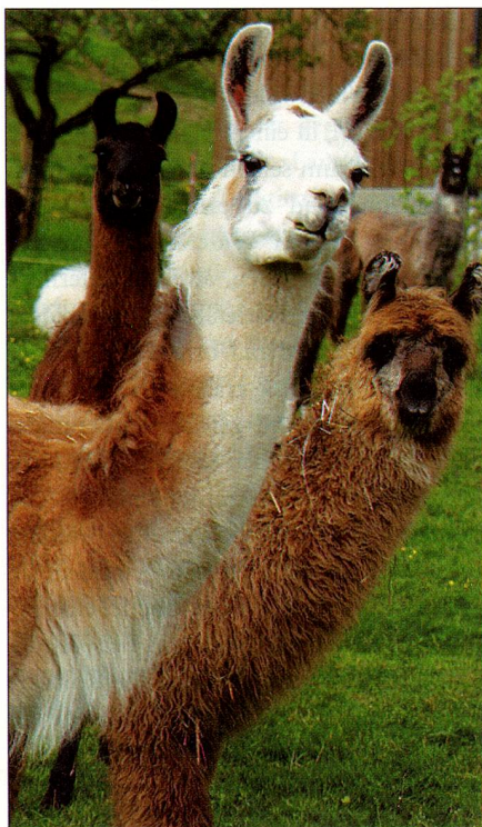
Patrick Lüthy / imagopress