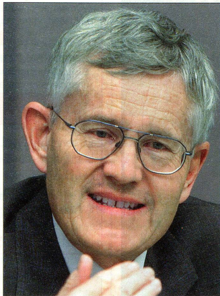
Siegreich: Kaspar Villiger.

DIE SCHULDENBREMSE , welche die im Hinblick auf die Sanierung der Bundesfinanzen bereits beschlossenen Massnahmen ergänzt und untermauert, wurde von 85 Prozent der Stimmenden angenommen, wobei der Jastimmen-Anteil in der lateinischen Schweiz leicht schwächer ausfiel. Finanzminister Kaspar Villiger kann nun also sein Präsidentsjahr mit dem Elan eines durchschlagenden Erfolgs in Angriff nehmen.