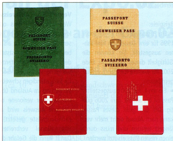
Erst seit 1959 gibt es den Schweizer Pass in Form des roten Büchleins.

Die hohen Sicherheitsstandards und die damit verbundenen beträchtlichen Investitionskosten in entsprechende Produktionsanlagen bedingen, dass die ordentlichen Pässe in Zukunft an einem zentralen Ort in der Schweiz und nicht mehr wie bis anhin von jeder Vertretung direkt vor Ort hergestellt werden. Das neue Ausstellungsverfahren verlängert deutlich die Zeitspanne von der Antragstellung bis zum Erhalt des Ausweises (je nach Land und Abklärungsbedarf können bis zu 30 Arbeitstage verstreichen). Um unnötige Unannehmlichkeiten zu vermeiden, bittet das Eidgenössische Departement für auswärtige Angelegenheiten alle Auslandschweizerinnen und Auslandschweizer, möglichst frühzeitig einen neuen Pass bzw. eine neue Identitätskarte zu bean-