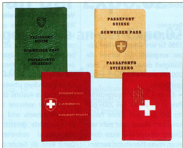
Erst seit 1959 gibt es den Schweizer Pass in Form des roten Büchleins.

Die Verordnung über die Einführung des Passes 2003 sieht vor, dass ab dem 1.1.2003 nur noch neue Passbüchlein (Pass 2003) ausgestellt werden. Die Gültigkeit des jetzigen Passes (Pass 85) wird ab diesem Zeitpunkt nicht mehr verlängert. Pässe, die vor dem 1. Januar 2003 ausgestellt oder →