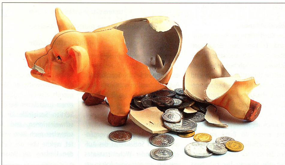
Wenn der Lebensunterhalt nicht mehr hinreichend aus eigenen Kräften und Mitteln bestritten werden kann, können Auslandschweizerinnen und Auslandschweizer gegebenenfalls Sozialhilfeleistungen beantragen.

Der Bund kann seine Sozialhilfeleistungen an Bedingungen oder Auflagen knüpfen. Wer sie nicht erfüllt, riskiert, dass die Behörden weitere Hilfe verweigern. Solche Bedingungen oder Auflagen können darin bestehen, dass die Hilfe ausdrücklich für einen bestimmten Zweck geleistet wird. Weitere Möglichkeiten: Der Unterstützte verpflichtet sich zu einem speziellen Rückzahlungsmodus, er tritt Ansprüche wie beispielsweise Unterhaltsforderungen ab, oder er leistet Sicherheiten. Letzteres kommt insbesondere dann vor, →