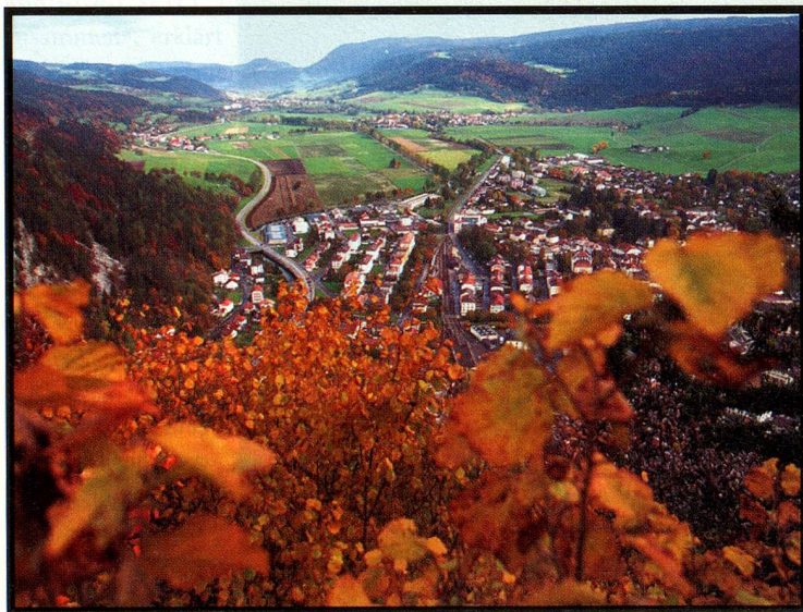
Blick auf das langgezogene Val-de-Travers, im Vordergrund Fleurier.