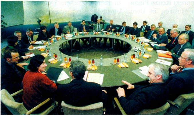
Die Gespräche am Runden Tisch haben zur langfristigen Sanierung der Bundesfinanzen beigetragen.