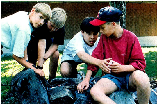
Sport, Spiel und Spass – das versprechen die Sommerlager für Auslandschweizer Kinder und Jugendliche in der Schweiz.

duktion der Lagerbeiträge (CHF 750.- bis 1000.-, ohne Reise bis zur Schweizer Grenze), damit kein Kind nur aus finanziellen Gründen nicht teilnehmen kann. Reisebeiträge können ebenfalls ausgerichtet werden.