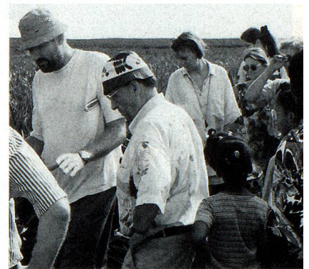
Visite de la plantation d'ananas de la famille Schmidt.