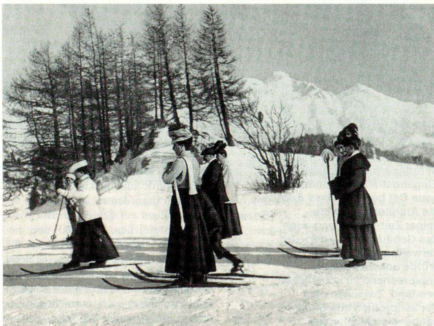
75 Jahre Schweizerische Verkehrszentrale: Skifahrerinnen von anno dazumal.

● In einer Militärkaverne am Sustenpass (Kt. Bern), die der unterirdischen Lagerung von nichtwiederverwertbarem Sprengstoff diente, ist aus ungeklärten Gründen 300–400 Tonnen sprengbares Material explodiert. Die Kaverne selbst wurde unter 50 000 m 3 Fels und Schutt begraben. Sechs Menschen fanden bei diesem Unglück den Tod.