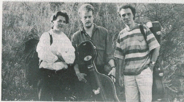
O "Arara Trio"

(Confirme locais e horários na imprensa local)