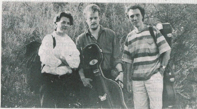
O "Arara Trio"

(Confirme locais e horários na imprensa local)