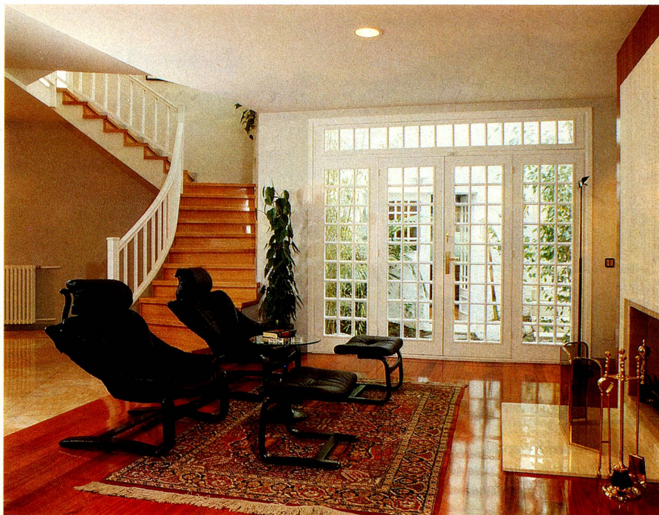
In den letzten 20 Jahren hat sich die Wohnfläche pro Person um mehr als 20 Quadratmeter erhöht.

Jede Massnahme hat irgendwelche Nebeneffekte. Jene Allzweck-Lösungen, die gleichzeitig die Wohnraumproduktion nicht beein-