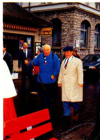
Nationalratspräsident Ulrich Bremi (l.) und Bundesrat Jean-Pascal Delamuraz (r.) in Brunnen.

Zur Überraschung der anwesenden Gäste, zu denen sich auch et-