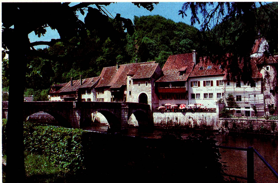
Konkret gibt es keinen Röstigraben; er ist lediglich ein treffendes Bild für die wachsenden Mentalitätsunterschiede zwischen Deutsch und Welsch. Unser Bild: St. Ursanne (Kt. Jura).

tochter «la sommelière» (nicht «la serveuse»), das Kuchenblech «plaque à gâteau» (nicht «moule à tarte»). Und es gibt Westschweizer Ausdrücke, die für Franzosen ebenso unverständlich sind wie Schweizerdeutsch für Deutsche, etwa: «Une voiture te gicle en roulant dans une gouille» (Ein Wagen spritzt dich beim Durchfahren einer Pfütze an). Doch zahlreiche Helvetismen – so «röstis» und «yasse» glänzen inzwischen bereits im «Petit Larousse».