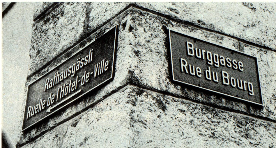
Die Zweisprachigkeit in der Stadt Biel/Bienne wirkt sich bis in die Verschiedenheit der Lehrpläne und Ferienregelungen aus.

Die Romandie hat kein gemeinsames Zentrum, sie bildet keine Einheit. Die politischen Institutionen sind völlig verschiedenartig; so ist die Gemeindeautonomie im Wallis extrem gross, in Genf fast inexistent. Die Kantone unterscheiden sich in der konfessionellen Tradition, die immer noch durchschimmert: in der Abstimmung über den Schwangerschaftsabbruch bildete sich über die Sprachgrenzen hinweg ein katholischer «Sonderbund». «Progressistisch» sind meist nur die Kantone im Jura oder in Juranähe: Genf, Waadt, Neuenburg und Jura, zu denen oft auch die beiden Basel stossen. Wichtige Entscheidungszentren liegen aus-