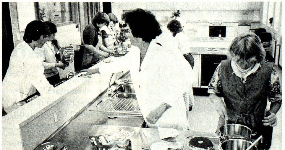
Gerade im praxisbezogenen Unterricht bevorzugen die Lehrer den schülernahen und «herrschaftsfreien» Dialekt.

Eine erste starke Gegenbewegung gegen diese kulturelle «Überfremdung» ging schon vor dem Ersten Weltkrieg von Bern aus und erfasste nach der Niederlage des Reichs bald die ganze deutsche Schweiz. Sie wurde verstärkt in der Nachkriegszeit mit ihrer Betonung der Demokratie und des Föderalismus, die beide in den verschiedenen Kantonsdialekten symbolisiert werden konnten, und erfuhr ihre staatliche Aufwertung in der Zeit der Geistigen Landesverteidigung, in der das Schweizerdeutsche als Bollwerk gegen den Nationalsozialismus of-