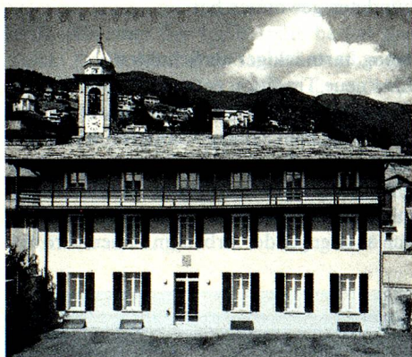
Die Casa Rusca in Locarno beherbergt die städtische Kunstsammlung Locarno und die Sammlung Hans Arp.

Fragen Sie auf der Strasse einen Touristen, warum er das Tessin liebt. Ob an der Strandpromenade von Lugano, unter den Toren von Locarno oder auf den Fusswegen hoch über den Seen – die Stichworte, die Sie zur Antwort bekommen, sind wahrscheinlich überall die gleichen: die Sonne, das milde Klima, der Wein Merlot und vielleicht auch die ... Pizza, die nun mit dem Tessin so