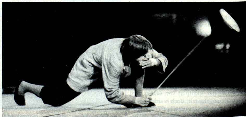
Der weltberühmte Clown Dimitri in Aktion.

Überall gelobt werden die erstrangigen Sommeraktivitäten wie das Filmfestival Locarno und die Musikfestwochen Ascona. Sie erleben einen derartigen Publikumszuwachs, dass die Organisatoren bei jeder Neuauflage vor neuen Platzproblemen stehen. Nach der abnehmenden Kurve der siebziger Jahre hat das Filmfestival heute seine Funktion als interessante Bühne für die noch nicht so bekannten Regisseure und für die immer unersättlicheren Filmliebhaber wieder gefunden. Trotzdem wäre es verfehlt, seitens des Publikums von einem genuinen Interesse für das Kino zu sprechen, denn diesem geht es oft mehr um das mondäne als um das kulturelle Ereignis: Ausserhalb der Festivaltage und mit Ausnahme von Lugano ist die Programmierung der Tessiner Kinosäle gegenüber den Städten nördlich der Alpen stark verzögert, und das Publikum ist oft nicht sehr zahlreich. Dies ganz im Gegensatz zu den ausverkauften Konzertsälen der Musikfestwochen Ascona.