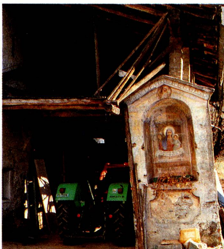
Die Landwirtschaft im Tessin ist heute marginal geworden.

Punkto Ideen und Vorsätze ist der Kanton Tessin in der Raumplanung ein Musterschüler. Der Tessiner Staatsrat gab sich nicht damit zufrieden, den vom Bund vorgeschriebenen kantonalen Richtplan selber auszuarbeiten, wie dies in mehreren Kantonen geschah. Der Richtplan, der festlegt, wo was gebaut werden darf und wo die Landschaft unversehrt gelassen werden soll, wird im Tessin vom Parlament beschlossen. Das demokratische Mitspracherecht geht so weit, dass die Tessinerinnen und Tessiner das Ergebnis jahrelanger Arbeit in einer Volksabstimmung bachab schicken können. So weit ist es noch nicht. Der Staatsrat stellte 1984 den Richtplan vor, seither wird daran herumgebastelt, doch wurde er dem Parlament noch nicht unterbreitet. Es fehlt der politische Wille – die Zahl der Bodenbesitzer ist gar gross –, klare Grundsätze zu