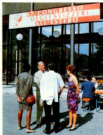
Ort der Begegnung: Der Auslandschweizer-Kongress.