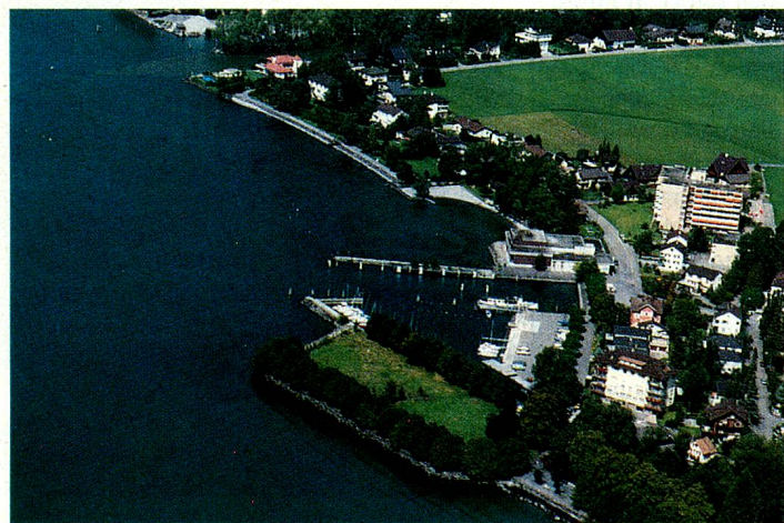
Auslandschweizer Architekten gestalten diese Halbinsel in der Bucht von Brunnen.

Ihre schriftliche Anmeldung mit einigen kurzen Angaben zu Ihrer Person, Ihrem Ausbildungsweg und über Ihre Tätigkeitsschwerpunkte wollen Sie bitte bis spätestens 1. Dezember 1989 (massgebend ist der Poststempel des Aufgabeortes) an folgende Adresse senden: Auslandschweizer-Sekretariat Architekturwettbewerb Alpenstrasse 26 CH-3000 Bern 16