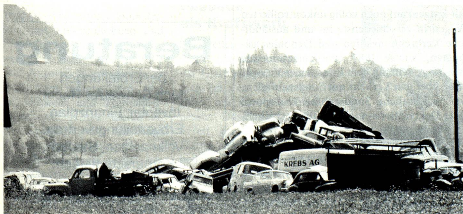
Aus den Augen, aus dem Sinn? Die Sanierung ungeeigneter Abfalldeponien dauert Jahre und verursacht enorme Kosten.

lawine volumenmässig einigermaßen zu bewältigen. In qualitativer Hinsicht wurde allerdings insbesondere die Tatsache, dass in der Schlacke, im Filterstaub und in der Abluft dieser Anlagen erhebliche Schadstoffe zurückbleiben, lange Zeit völlig verdrängt. Neben den KVA, in denen rund 80 Prozent der Siedlungsabfälle verbrannt werden, bestehen in der Schweiz nur vereinzelte Anlagen zur Verwertung bzw. zur Weiterbearbeitung spezieller Abfallstoffe. Zu nennen sind etwa Kompostieranlagen für die in einzelnen Regionen separat gesammelten Grünabfälle, die Anlagen der Industrie zum Altpapier-, Altglas- und Altmetall-Recycling, verschiedene Anlagen zur Abtrennung von Öl, Fett und Lösungsmitteln aus verschmutzten Abwässern sowie einzelne im Auf- und Ausbau begriffene Triage- und Vorbehandlungszentren für Sonderabfälle. Das letzte Glied der Kette bilden – neben den Transporteuren, die viele ungeliebte Stoffe ins Ausland verfrachten – die Deponien. In diesem Bereich wurden auf der Basis des Gewässerschutzgesetzes von 1971 und der darauf abgestützten Deponiericht-