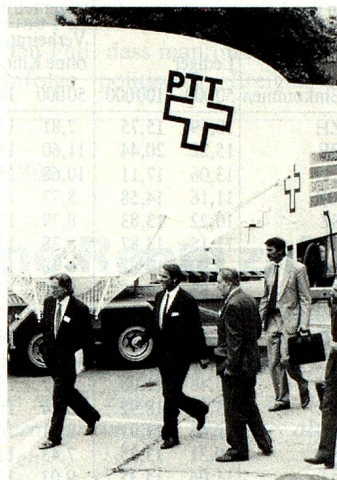
Das «Ohr» zur Welt: Bundesrat Ogi (Mitte) vor der transportablen Satelliten-Bodenstation in Näfels.

Minister Fetscherin, Chef des Auslandschweizerdienstes im EDA, beschäftigte sich zur Hauptsache mit den schon heute bestehenden Problemen, denen sich die Schweizer in EG-Ländern gegenübersehen und diagnostizierte eine fortschreitende «passive Diskriminierung»: Es muss nämlich angenommen werden, dass im allgemeinen die zunehmende Verbesserung der Lage der EG-Ausländer – ohne dass dieser Prozess bewusst gefördert würde – vermehrt zu einer subjektiven Verschlechterung der Stellung der Auslandschweizer führen