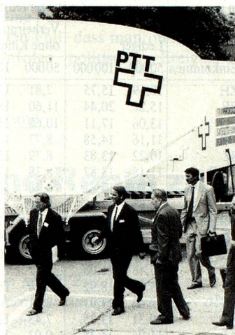
Das «Ohr» zur Welt: Bundesrat Ogi (Mitte) vor der transportablen Satelliten-Bodenstation in Näfels.

Minister Fetscherin, Chef des Auslandschweizerdienstes im EDA, beschäftigte sich zur Hauptsache mit den schon heute bestehenden Problemen, denen sich die Schweizer in EG-Ländern gegenübersehen und diagnostizierte eine fortschreitende «passive Diskriminierung»: Es muss nämlich angenommen werden, dass im allgemeinen die zunehmende Verbesserung der Lage der EG-Ausländer – ohne dass dieser Prozess bewusst gefördert würde – vermehrt zu einer subjektiven Verschlechterung der Stellung der Auslandschweizer führen