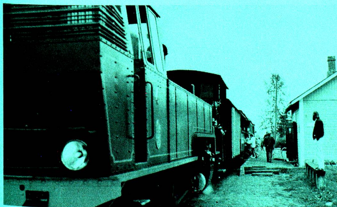
Auf dem Bahnhof von Minkiö.