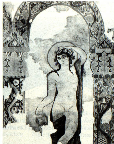
Der Weingott, eine Einzelfigur aus dem Dionysos-Teppich.

Zusammen mit zwei andern Figurenteppichen und vielen kleineren Stücken ist dieser