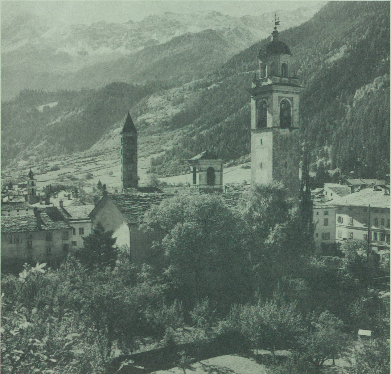
Poschiavo. (Schweiz. Verkehrszentrale Zürich)