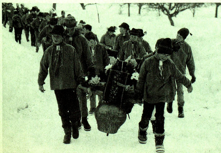
«Chalandamarz» – ein alter Brauch, mit dem die Engadiner Jugend alljährlich den Frühling einleitet.