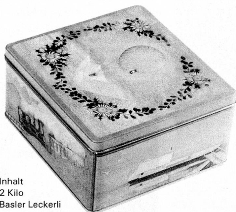
Inhalt 2 Kilo Basler Leckerli

Wir freuen uns, wenn wir auch Ihnen recht bald einen süssen Gruss aus Basel senden dürfen.