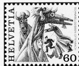
Schnabelgeissen, Ottenbach ZH