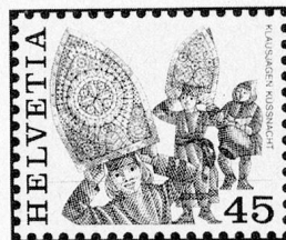
Klausjagen, Küssnacht a. R. SZ