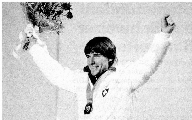
Max Julen, erste Schweizer Goldmedaille der Winterspiele. Er gewann die Goldmedaille im Riesenslalom der Herren.