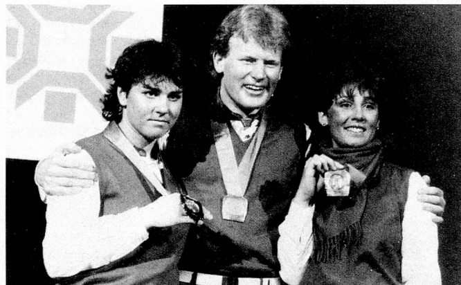
Am 16. Februar 1984 errang die Schweiz drei Medaillen an einem Tag: von links, Michela Figini (Gold, Abfahrt Damen), Peter Müller (Silber, Abfahrt Herren), Maria Walliser (Silber, Abfahrt Damen).