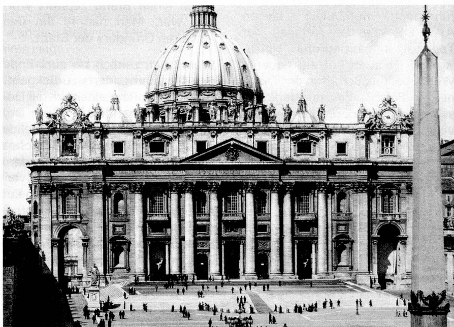
Fassade der St. Peter-Kirche in Rom, rechts der berühmte Obelisk.

Wir hörten gerade von der romanischen Periode, deren Beeinflussung durch eine intensive Tätig-