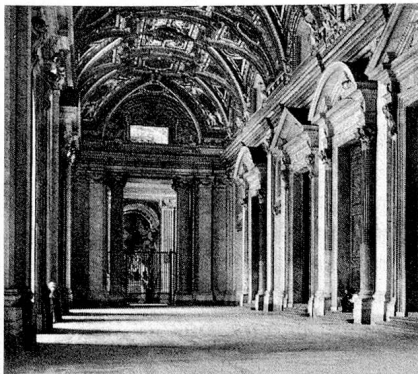
Eingang zur St. Peter-Kirche mit Deckenverzierung aus Stukkatur.

bei jedem Werk, bei dem er volle Handlungsfreiheit besass, zum Beispiel mit der Erstellung des herrlichen prunkvollen Eingangs zu einem Gewölbe aus Stukkatur; weit eindrucksvoller ist jedoch die enorme Fassade, welche den St. Peterplatz dominiert.