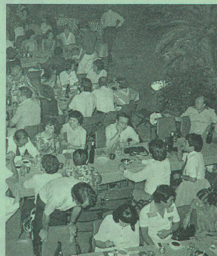
Photograph of 1st of August 1983

this year's spring event. It was a day full of fun, with a «sporty» picnic and numerous games. Many of us proved their topfitness or ... realized that rusty muscles needed oil!