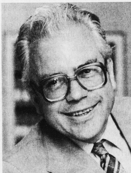
Bundeskanzler Walter Buser

Die Bundeskanzlei ist die zentrale Stabsstelle des Bundesrates. Sie koordiniert den Ablauf der Geschäfte und bereitet die Sitzungen des Bundesrates vor. Sie unterstützt den Bundespräsidenten bei der Leitung der Regierungsge-