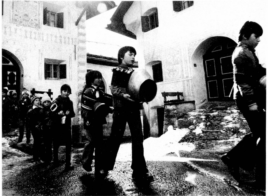
Chalanda-Marz: Ein alter Frühlingsbrauch in Graubünden

Es gibt auf unserer Welt nur wenig Völker, die sich durch eine derartige Vielfalt auszeichnen wie das unsere. Auf eng begrenztem Raum existieren eine Unzahl von Gruppen. Für jeden Tätigkeitsbereich gibt es mehrere Organisationen, von denen jede von sich behauptet, auf diesem Gebiet allein kompetent zu sein. Man denke nur an die Vereinigungen in Industrie, Gewerbe und Verwaltung, von denen es in der Schweiz über 1300 gibt. Die Anekdote, wonach jedesmal, wenn drei Schweizer zusammenkommen, ein Verein