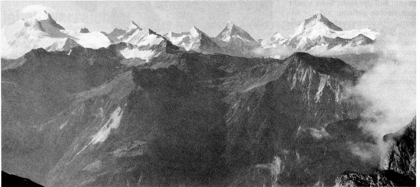
Von links nach rechts: Weisshorn, Zinalrothorn, Obergabelhorn und Dent Blanche

sind wir gelegentlich nicht mehr in der Lage zu handeln.