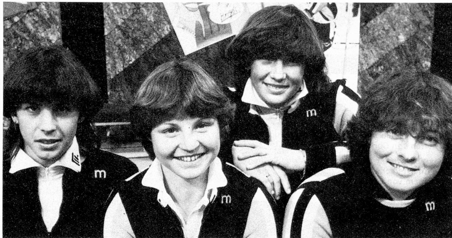
Von links nach rechts: Doris de Agostini, Erika Hess, Maria Walliser und Marie-Theres Nadig.

«jetzt habe ich erst so richtig begriffen, wie es läuft. Das gibt mir Auftrieb für das Training im Sommer».