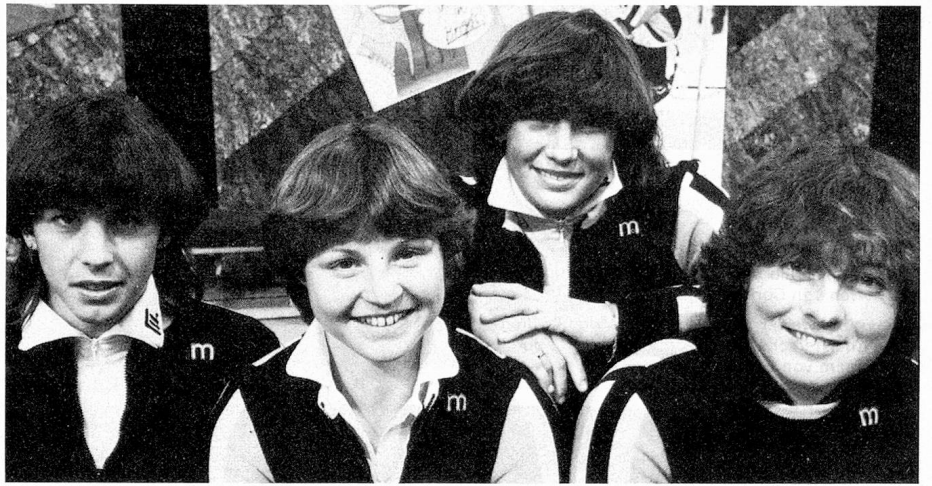
Von links nach rechts: Doris de Agostini, Erika Hess, Maria Walliser und Marie-Theres Nadig.

Wenn Marie-Theres Nadig und Erika Hess am häufigsten in den Schlagzeilen auftauchen, so haben jedoch auch andere zum überlegenen Triumph der Mannschaft Schweiz im Nationencup – der erste Sieg in der 15jährigen Geschichte des Weltcups! – beigetragen. In erster Linie ist Doris de Agostini zu nennen, die nach einer langen Durststrecke dank einem Markenwechsel und einem gewieften Ski-Servicemann, der sie immer «aufstellt», ihre beste Saison erlebte und bereits jetzt als grosse WM-Favoritin für die Abfahrt in Haus im Ennstal gilt. Die Gleitspezialistin aus Airolo hat vor allem in technischer Hinsicht Fortschritte gemacht und fährt heute die Kurven wesentlich besser als noch vor ein, zwei Jahren. Im gleichen Atemzug wie de Agostini muss Maria Walliser erwähnt werden. Die am 27. Mai erst 18 Jahre alt werdende bildhübsche Toggenburgerin aus Mosnang bestritt ihre erste volle Weltcupssaison und schlug ein wie eine Bombe. Die ersten Punkte holte sie beim ersten Rennen in Val d'Isère, am Ende hatte die Torlaufspezialistin in allen Disziplinen gepunktet und war die erfolgreichste Newcomerin der Saison. Sprühend vor Ehrgeiz und Spass am Skifahren erklärte Pferdenärrin Maria Walliser, die trotz Weltcupstress ihre Bürolehre mit guten Zensuren erfolgreich abschloss,