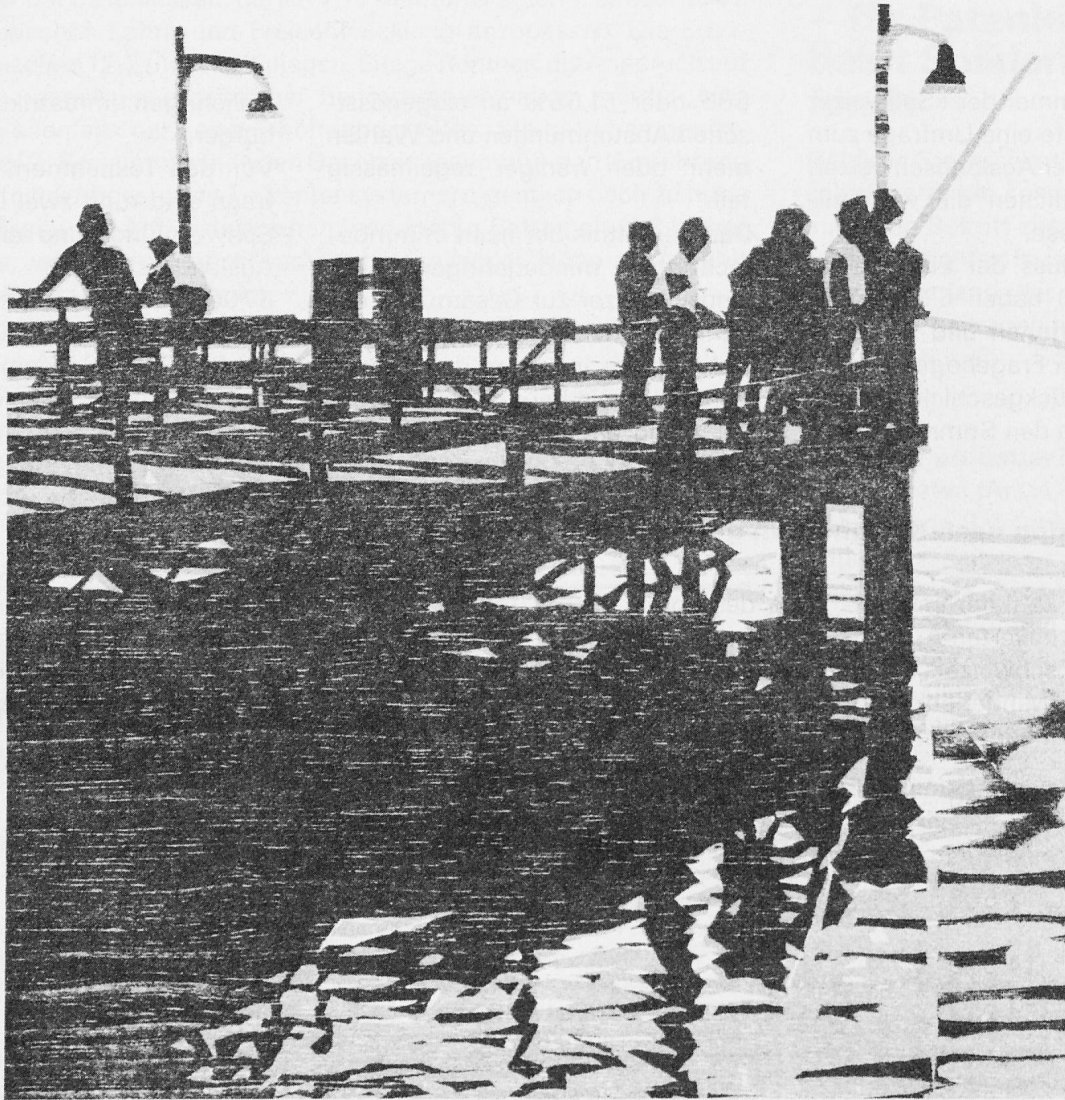
(Holzschnitt von Martin Thönen, Bern)