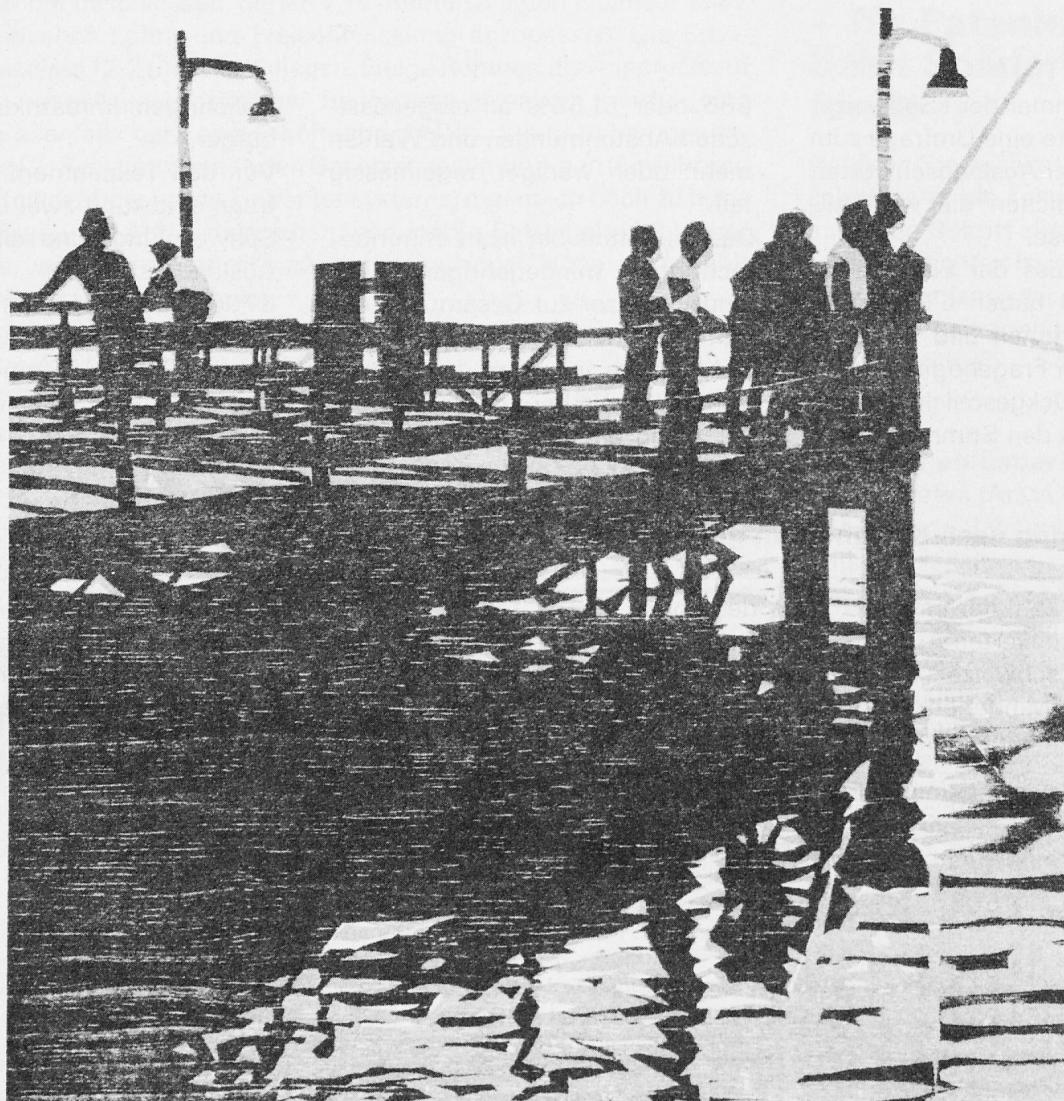
(Holzschnitt von Martin Thönen, Bern)