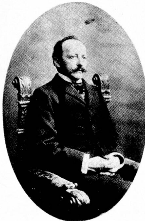
César Ritz, geboren 1850 in Niederwald, Wallis, gestorben 1918; einer der berühmtesten England-Schweizer

Die erstaunliche Geschichte von Schweizern jenseits des Ärmelkanals von der romanischen Zeit bis zur Europäischen Gemeinschaft.