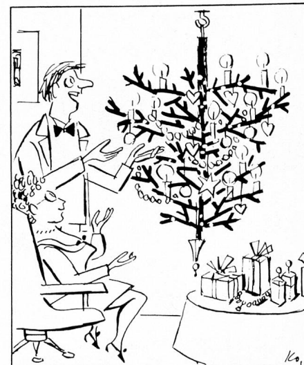
„Na, Liebling, ist das nicht ein ganz neues Festgefühl?“

Herausgegeben durch den Schweizerischen Esperanto-Verein mit der Unterstützung der Koordinationskommission für die Präsenz der Schweiz im Ausland, verfasst von Arthur Baur, Chefredaktor des «Landboten» in Winterthur und Esperantochronist bei «Radio Schweiz International». Ein einzigartiges Land wird einzigartigen Lesern beschrieben.