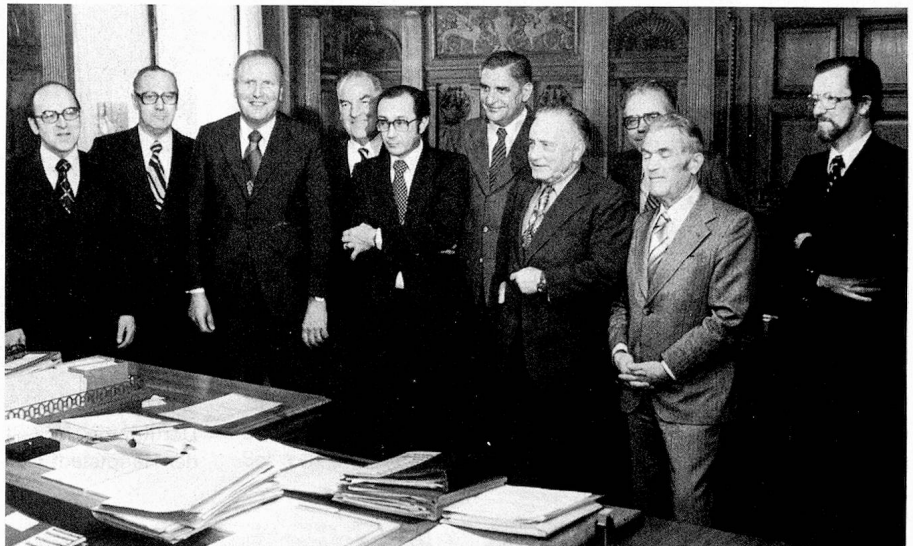
Die Bundesräte vereint mit den Verantwortlichen der Bundeskanzlei. Erkennen Sie sie? (Siehe Seite 11)