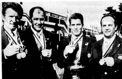
In Korea gewinnen die Schweizer Schützen Gold.