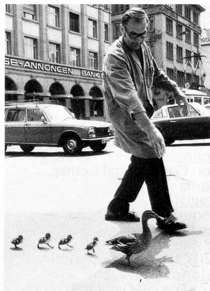
Wir wünschen allen Lesern einen reibungslosen Übergang ins 1979, wie dies die Entenfamilie an den Ufern der Limmat in Zürich demonstriert.