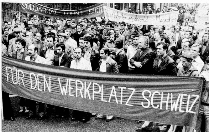
Soziale Unruhen in der Schweiz. Hier die Betriebsschliessung der Pneuabfabrik Firestone in Pratteln.