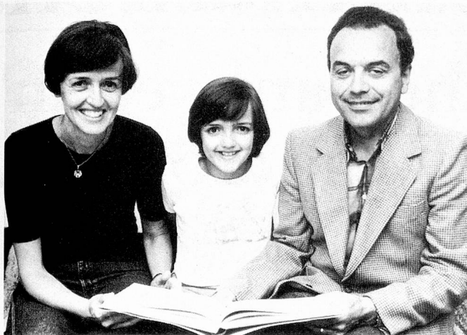
Der Basler Professor und Forscher Werner Arber erhält den Nobelpreis für Medizin. Hier zusammen mit seiner Frau und Tochter.