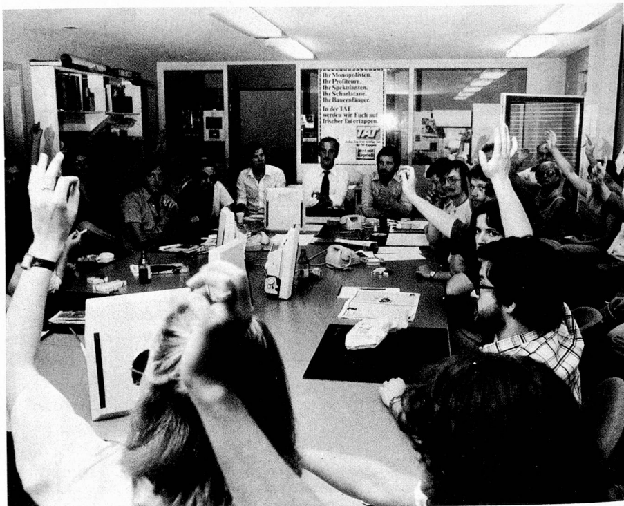
Erster Journalistenstreik in der Schweiz. Die von der Migros herausgegebene Boulevardzeitung, die «TAT» wird wegen Meinungsverschiedenheiten eingestellt.