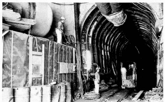
Der Schweizer Verschlinger... Ursprünglich auf 70 Millionen budgetiert, werden die Kosten des Furka-Tunnels 300 Millionen überschreiten.