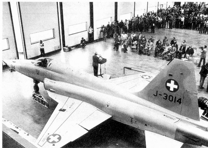
Die ersten Kampfflugzeuge Northrop F-5 «Tiger» treffen in der Schweiz ein.