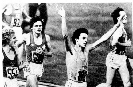
Silber für Markus Ryffel (Nr. 680) bei den 5000 m der Halleneuropameisterschaften.