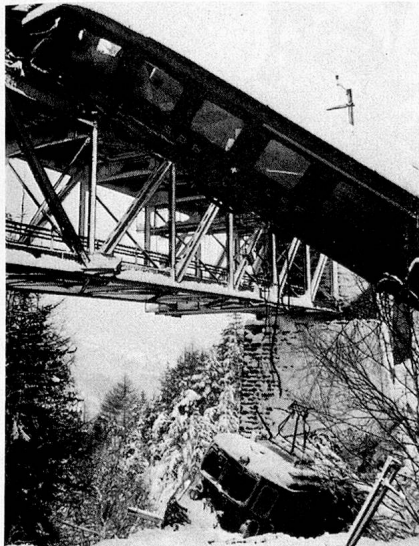
Lawinen haben den Verkehr in der Schweiz beeinträchtigt; auf der Lötschberglinie hat eine Lawine einen schrecklichen Unfall verursacht.