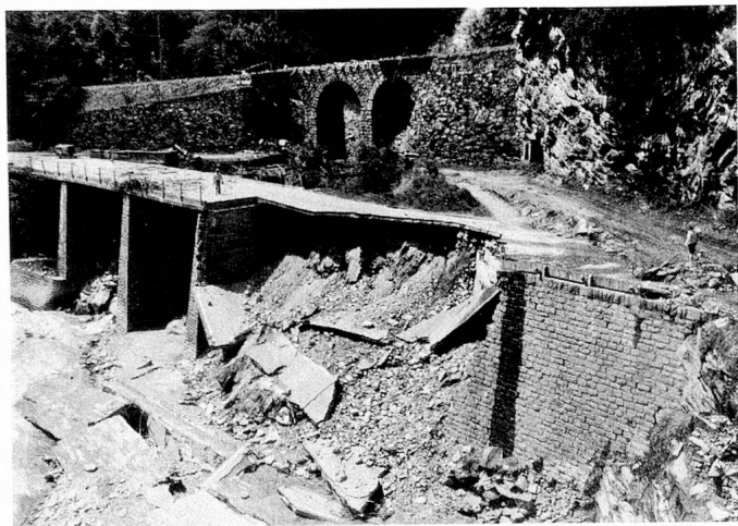
Sintflutähnliche Niederschläge auf der Alpensüdseite haben beträchtlichen Schaden angerichtet.