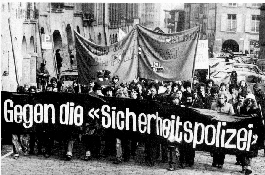
Viele Meinungsverschiedenheiten hat die Abstimmung über eine Bundes-Sicherheitspolizei hervorgerufen. Das Volk hat das Projekt verworfen.