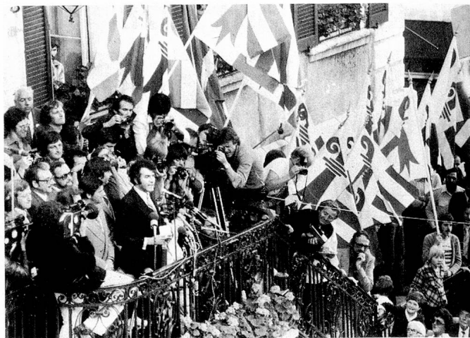
Der Kanton Jura ist vom Bund anerkannt worden. Versammlung in der Hauptstadt Delémont.