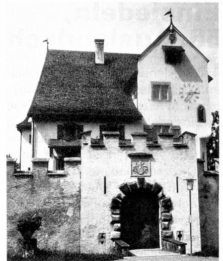
Das kleine Schloss A Pro in Seedorf

Theatro Massimo in Palermo be-rufen. Darüber hinaus gibt es in Uri eine ganze Anzahl junger Maler, welche sich um den Anschluss an das neuzeitliche Kunstschaffen bemühen. Selbstverständlich seien auch die Tellspiele Altdorf nicht vergessen, welche seit bald 80 Jahren im eigenen Festspielhaus Schillers «Wilhelm Tell» periodisch zur Aufführung bringen; das jüngste Theaterunternehmen, das Kellertheater in Altdorf, darf als einen glücklichen Beitrag zur neuzeitlichen Kunst gewertet werden. In den Kulturkreis Uri gehört auch das von verschiedenen Seiten gepflogene Schrifttum (Poesie, Erzählung, Geschichtsforschung, Geisteswissenschaften, Volkskunde) und ein hübsches Brauchtum, welches sich bei kirchlichen und weltlichen Anlässen immer wieder manifestiert (Sankt Nikolaus, Fastnacht, Volksmusik, Trachtenwesen, Prozessionen und Landwallfahrten). Das Historische Museum in Altdorf, das Tellmuseum in Bürglen und die Sommerausstellungen im Schloss A Pro in Seedorf sorgen dafür, dass das reiche einheimische Kunst- und Kulturgut, soweit es in Sammlungen vereinigt ist, auch angesehen werden kann. Nun sei dieser kleine Exkurs in den