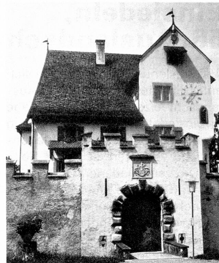
Das kleine Schloss A Pro in Seedorf

Theatro Massimo in Palermo be-rufen. Darüber hinaus gibt es in Uri eine ganze Anzahl junger Maler, welche sich um den Anschluss an das neuzeitliche Kunstschaffen bemühen. Selbstverständlich seien auch die Tellspiele Altdorf nicht vergessen, welche seit bald 80 Jahren im eigenen Festspielhaus Schillers «Wilhelm Tell» periodisch zur Aufführung bringen; das jüngste Theaterunternehmen, das Kellertheater in Altdorf, darf als einen glücklichen Beitrag zur neuzeitlichen Kunst gewertet werden. In den Kulturkreis Uri gehört auch das von verschiedenen Seiten gepflogene Schrifttum (Poesie, Erzählung, Geschichtsforschung, Geisteswissenschaften, Volkskunde) und ein hübsches Brauchtum, welches sich bei kirchlichen und weltlichen Anlässen immer wieder manifestiert (Sankt Nikolaus, Fastnacht, Volksmusik, Trachtenwesen, Prozessionen und Landwallfahrten). Das Historische Museum in Altdorf, das Tellmuseum in Bürglen und die Sommerausstellungen im Schloss A Pro in Seedorf sorgen dafür, dass das reiche einheimische Kunst- und Kulturgut, soweit es in Sammlungen vereinigt ist, auch angesehen werden kann. Nun sei dieser kleine Exkurs in den