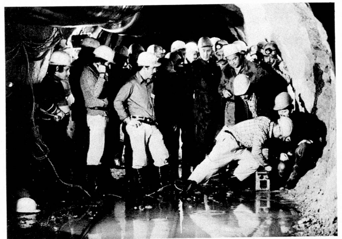
Der Gotthard-Tunnel nimmt Form an: hier die letzte Sprengung.