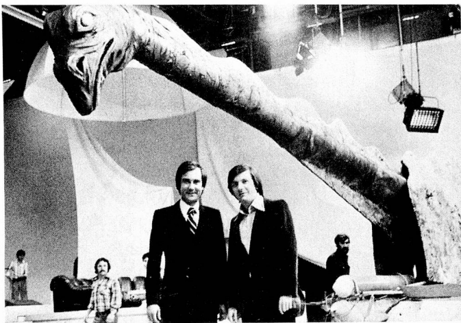
Das künstliche Ungeheuer «Brunnie» verwirrte mehr als nur einen, als es plötzlich aus dem Vierwaldstättersee tauchte.