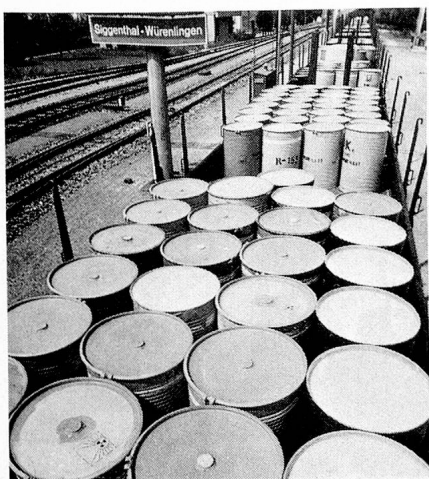
Was geschieht mit dem radioaktiven Atom-müll?