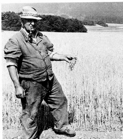
Die Verwüstungen der Dürre: das Korn reift nicht.