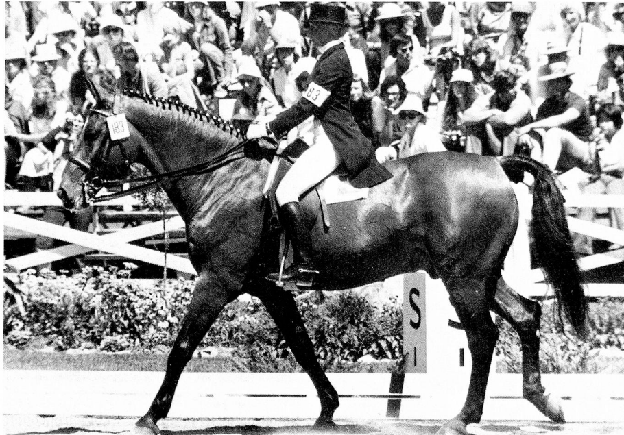
In Montreal gewinnt Christine Stückelberger auf Granat die Goldmedaille im Dressurreiten.