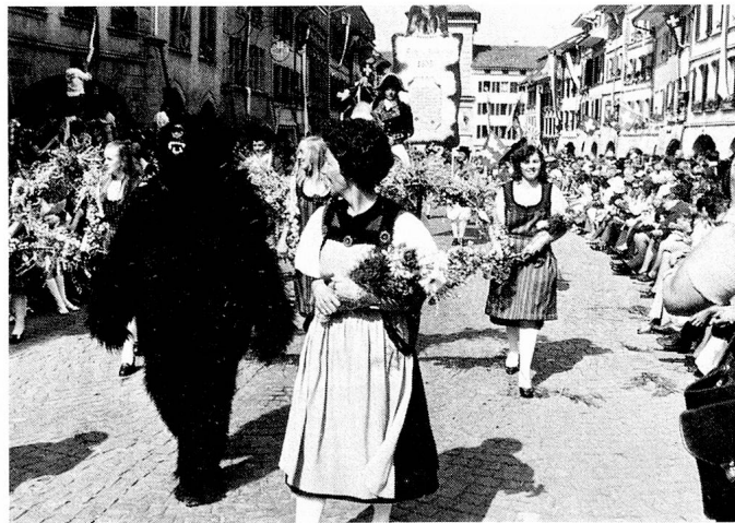
1976 war «das Jahr» des Städtchens Murten, das die Gründung der Stadt vor 800 Jahren und den 500. Jahrestag der berühmten Schlacht von Murten feierte.