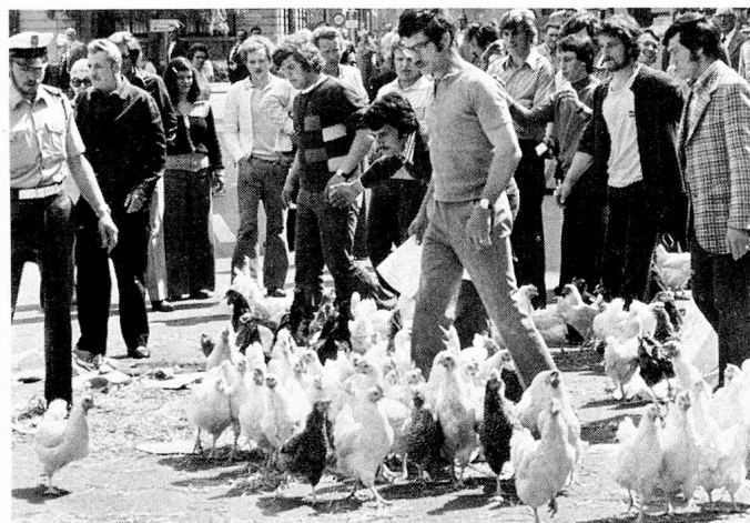
Auf dem Bundesplatz werden Legehennen freigelassen: eine spektakuläre Demonstration gegen die massiven Eierimporte.