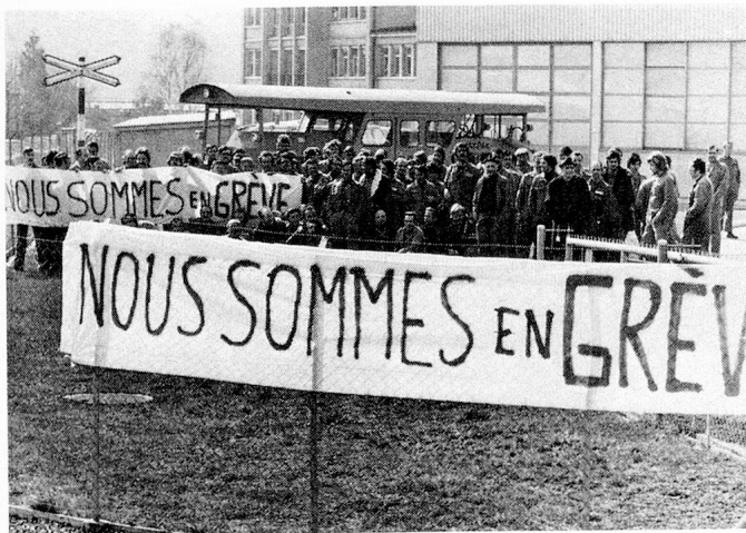
Ein für die Schweiz aussergewöhnliches Bild: die Rezession ist für vieles verantwortlich.