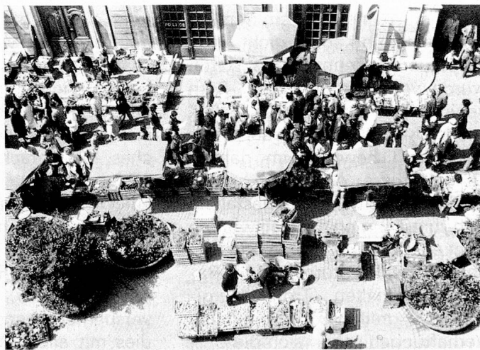
Markt auf dem «Place de la Palud» in Lausanne