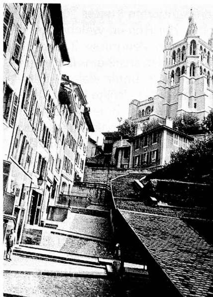
Lausanne – die mittelalterlichen Markttreppen

Es bedurfte eines besondern Anstosses von aussen, um dem Berner Regime ein Ende zu setzen. Dieser kam mit der Revolution im benachbarten Frankreich, wobei die allgemeine Auflehnung auf ein recht harmloses, fast möchten wir sagen, typisch waadtländisches Ereignis zurückging. Im Frühjahr 1791 verkündete ein Pfarrer Martin im Dorfe Mézières, dass die Kartoffel ein Gemüse und nicht ein Samenkorn sei und somit nicht unter die Steuer des Zehnten falle. Martin wurde verhaftet und nach Bern geführt, wo er übrigens alsbald wieder freigelassen wurde. Seine Festnahme bewirkte im ganzen Lande grosse Aufregung, seine Rückkehr nach Mézières gestaltete sich zum Triumph. Überall wurden Bankette zu seinen Ehren und zum Jahrestage des Sturms auf die Bastille abgehalten. Trotz energischem Eingreifen mit Truppen und Verhaftungen sahen sich die Ber-