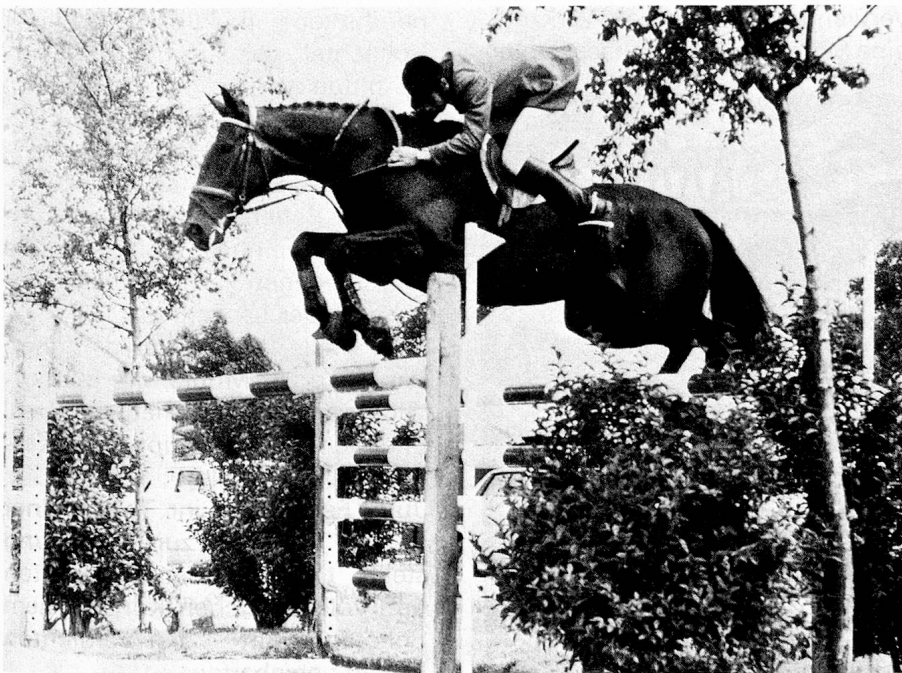
Schweizer Meister Walter Gabathuler auf Butterfly III.