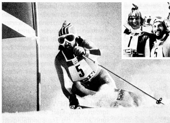
Aussergewöhnliches Resultat im Riesenslalom: Heini Hemmi und Ernst Good gewannen Gold- und Silbermedaille. Hemmi, unser Olympiamedailengewinner, in voller Aktion.