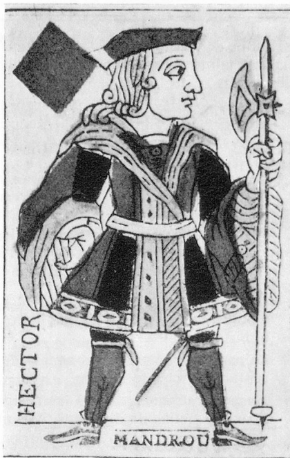
Carte à jouer de J.-J. Rousseau, tirée de la Revue neuchâteloise n° 51

Le jass est vraiment un jeu national dont les règles subissent de nombreuses interprétations locales. Naguère, les cafés affichaient un règlement anonyme parfois approuvé par une société cantonale de cafetiers, dans un endroit mal éclairé, difficilement accessible. Les jasseurs qui ont lu ces règlements sont une infime minorité, d'où cette floraison d'interprétations locales. Il existe de nombreuses conventions qui servent d'ententes entre partenaires, non enregistrées dans un règlement, quoique parfaitement correctes.