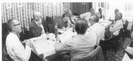
Bureau du Fonds de solidarité.