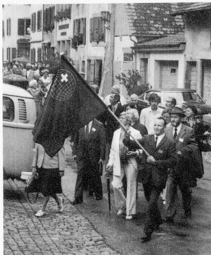
Drapeau en tête, les Suisses de l'étranger se rendent au service religieux œcuménique.