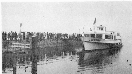
Avec le «Ville de Neuchâtel».