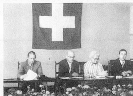
Commission de coordination de l'information.