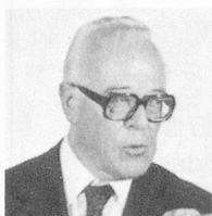
M. Pierre Graber, Conseiller fédéral, Chef du Département politique fédéral.