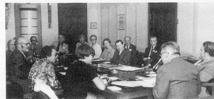
Séance des amis de l'Organisation des Suisses de l'étranger.