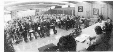
Aula de l'école secondaire.