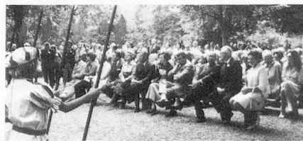
A la «Lindensaal».