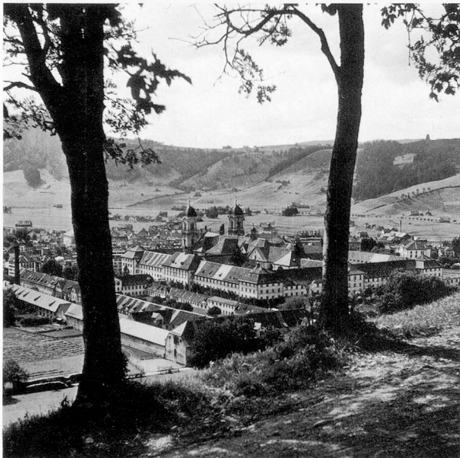
Vue du couvent bénédictin d'Einsiedeln, construit en 1720–1726 par Caspar Mossbrugger (ONST)