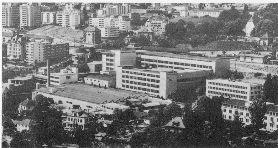
Vue générale des fabriques de Chocolat Suchard S.A., Neuchâtel

Fondée en 1826 par Philippe Suchard, pionnier de l'industrie chocolatière, cette importante entreprise neuchâteloise est passée rapidement du stade artisanal au niveau industriel.