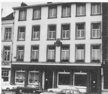
Le « Foyer » de l'Armée du Salut. 87 rue Grétry à Liège. 45 lits. Institution pour hommes.