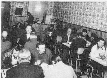
Une partie du restaurant

Un nouveau Comité d'Honneur est en voie de formation pour appuyer un nouvel appel à la population liégeoise et les demandes de subsides à présenter à certaines Autorités. Les personnalités suivantes ont bien voulu accepter d'en faire partie (d'autres réponses sont attendues) :