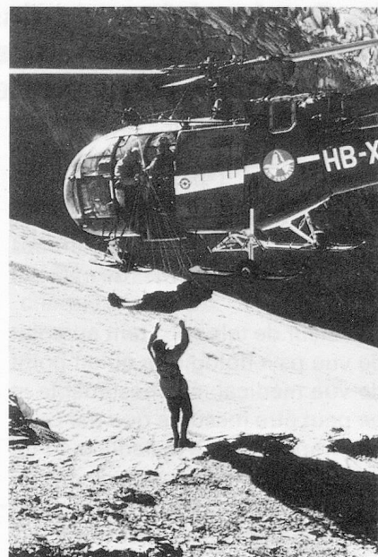
Sauvetage en haute montagne, chargement à bord d'un hélicoptère Alouette III au moyen d'un filet.

ler, médecin, aujourd'hui président, alors chef technique, procéda à la réorganisation de la GASS et à sa scission intégrale d'avec la Société suisse de sauvetage. On érigea en même temps, selon des critères topographiques et météorologiques, une organisation embrassant toute la Suisse. Ce n'est que plus tard que l'on procéda à une décentralisation du matériel de sauvetage en répartissant celui-ci sur différents dépôts de base dans les aérodromes de Zurich-Kloten, Mollis, Samedan, Magadino, Zermatt, Sion, Berne, Colombier, Genève, Interlaken et Bâle.