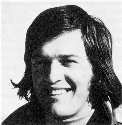
◀ Bernhard Russi, une deuxième place méritée dans la descente à ski.