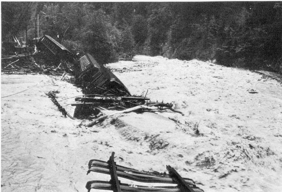
Accidente ferroviario cerca de Davos

ción de la industria de la construcción descienda a un nivel inferior a las necesidades a largo plazo, de reglamentar el seguro contra la desocupación y de adaptar la garantía contra los riesgos a la exportación.