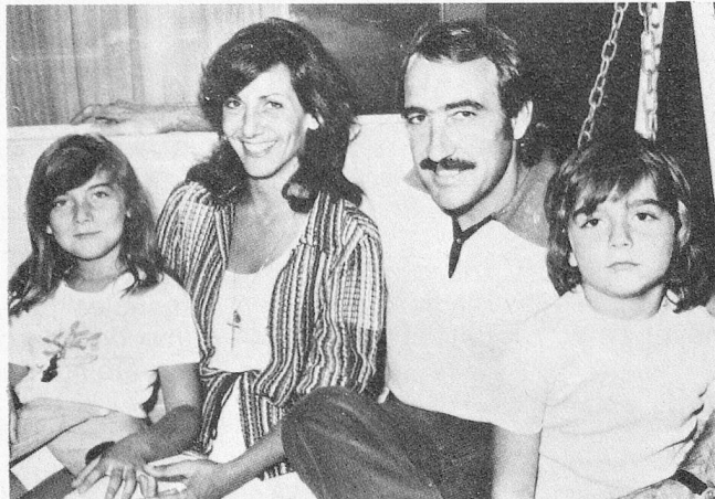
...en rueda familiar