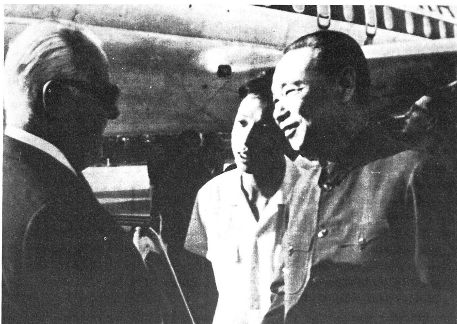
Bundesrat Pierre Graber wird in Peking von seinem chinesischen Amtskollegen Tschi Peng Fei empfangen.