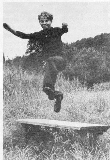
Les obstacles, connais pas...