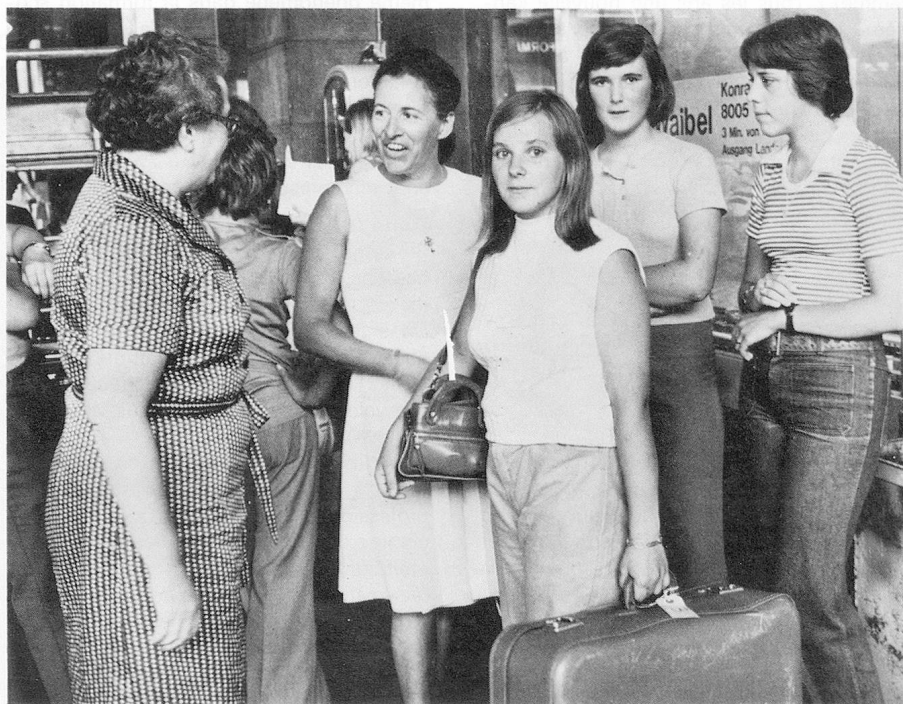
La rencontre.