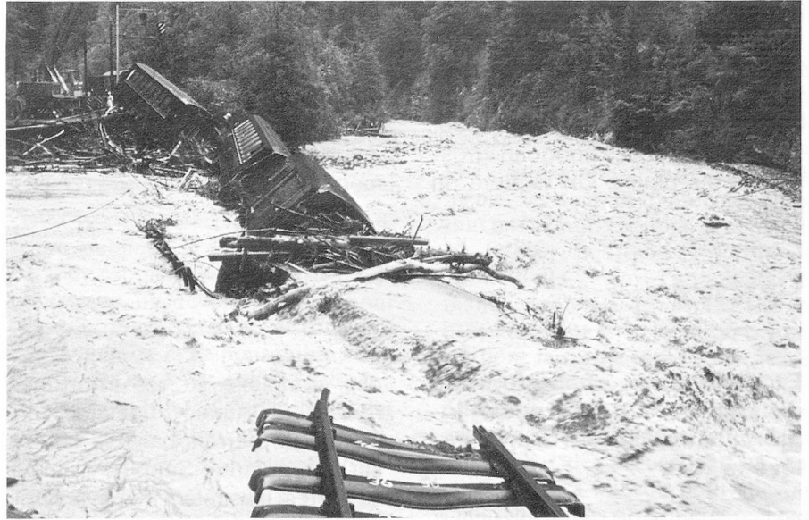
Accident ferroviaire près de Davos.

Le comité d'initiative de Berthoud dépose à Berne son initiative pour