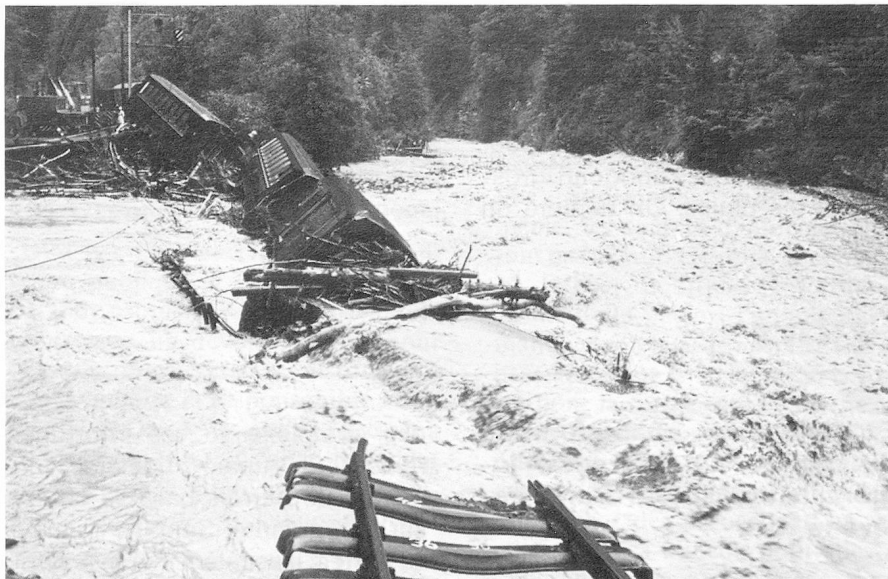
Accident ferroviaire près de Davos.

Le comité d'initiative de Berthoud dépose à Berne son initiative pour